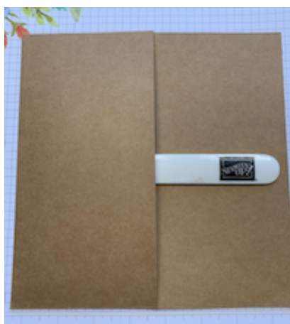
(Seite 1 innen)

Der CS wird bei 8 gefaltet und zur seitlichen Tasche gefaltet. Oben und unten wird jeweils ein Streifen 1 x 4 eingeklebt, so dass die Tasche ein wenig stabiler wird. (Das wird bei allen anderen Taschen ebenso gemacht.)